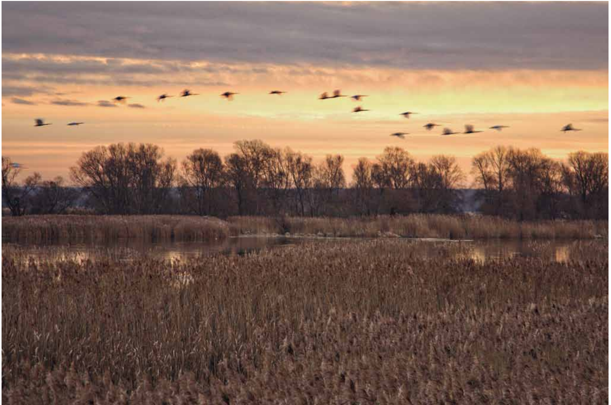
Nördlich von Kienitz

1 2 3 4 5 6 7 8 9 10 11 12 13 14 15 16 17 18 19 20 21 22 23 24 25 26 27 28 29 30 Mo Di Mi Do Fr Sa So Mo Di Mi Do Fr Sa So Mo Di Mi Do Fr Sa So Mo Di Mi Do Fr Sa So Mo Di