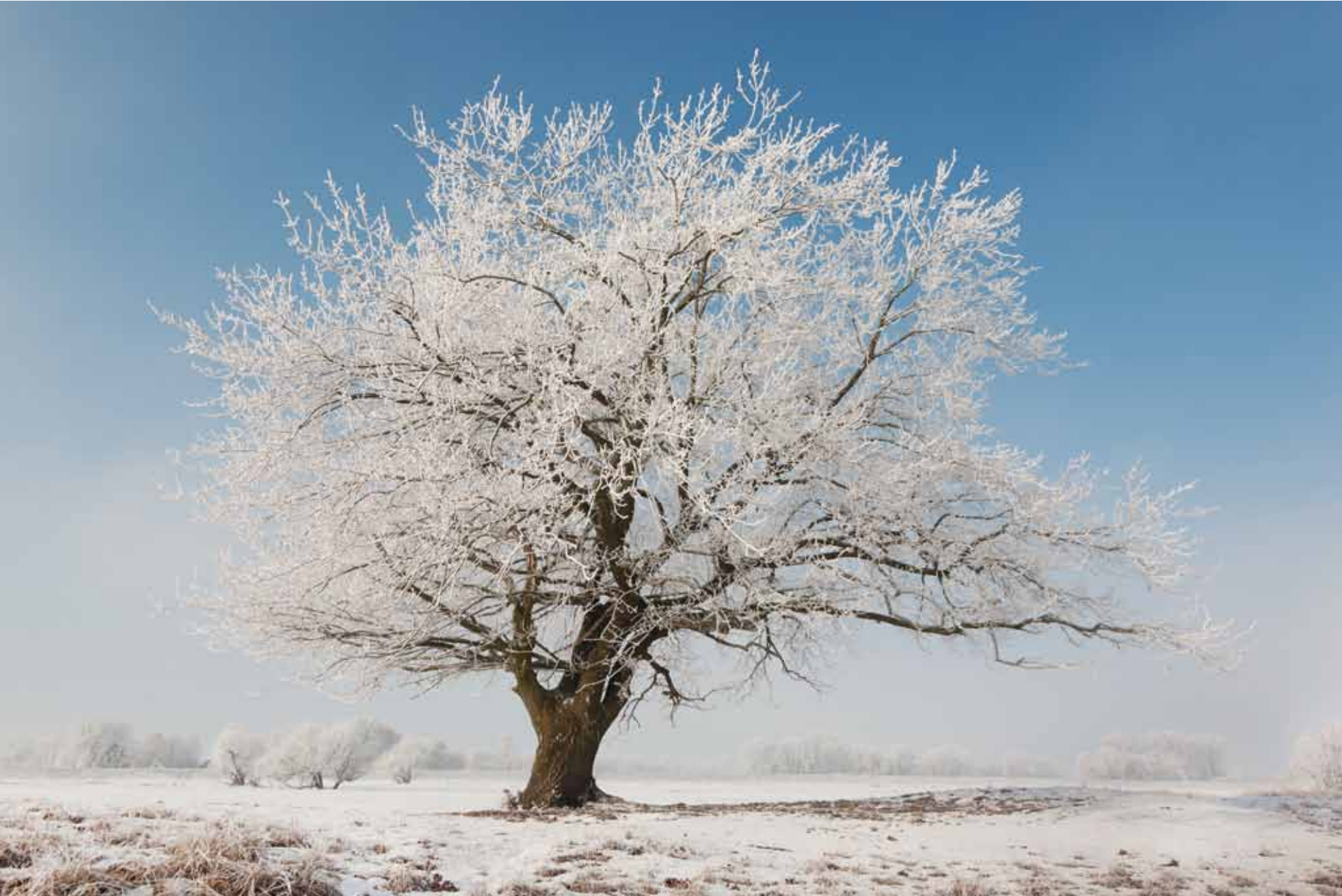
Bei Groß Neuendorf

1 2 3 4 5 6 7 8 9 10 11 12 13 14 15 16 17 18 19 20 21 22 23 24 25 26 27 28 29 30 31 Mo Di Mi Do Fr Sa So Mo Di Mi Do Fr Sa So Mo Di Mi Do Fr Sa So Mo Di Mi Do Fr Sa So Mo Di Mi